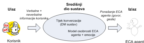
Slika 1. Općeniti model sustava sa ECA agentima

Da bi se ispunili navedeni zahtjevi, sustavi bazirani na ECA agentima trebaju imati komponente koji će detektirati govor i pokrete, odnosno zahtjeve korisnika, obraditi ih sukladno stanju konverzacije te generirati odgovor putem slike i zvuka, odnosno grafičkog prikaza čovjeka koji govori i gestikulira sa korisnikom. Navedena tvrdnja se jednostavno može prikazati slikom 1. Kao ulaz sustav objedinjuje verbalni i neverbalni kanal korisnika i detektira volju korisnika iz skupljenih informacija. U središnjem dijelu ECA sustava, koji predstavlja „inteligenciju“ ECA agenta se ulazna informacija koristi kao pobuda personifikacijskog modela agenta (emocije, osobnost, kultura), a koje ovisi o stanju konverzacije. Kao rezultat se dobije ponašanje agenta koje se generira na izlazu. Sve ovo objedinjuje širok spektar istraživačkih znanosti, od obrade signala zvuka, detekcije pokreta i obrade slike, preko umjetne inteligencije i personalizacije agenata (modeliranje emocija i osobnosti), do generiranja govora i animacija pokreta tijela.