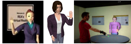
Slika 4. Rezultat sinteze gesti u ECA sustavima: REA; GRETA; MAX

Većina animacija u opisanim sustavima se generira proceduralno, odnosno programskom kontrolom parametara na tijelu (definiranih npr. MPEG-4 standardom) koja prati fizikalne zahtjeve gibanja. Na ovaj način se postiže visoka kontrola pokreta, ali rezultat su najčešće animacije koje nemaju prirodnu dinamiku